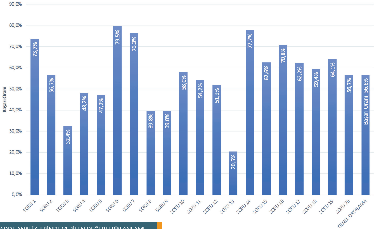
Soru Bazlı Başarım Oranları